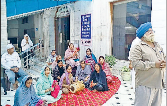
झज्जर। पुरु गुरुनानक देव साहिब के प्रकाश पर्व के उपलक्ष्य में कीर्तन करती महिलाएं।