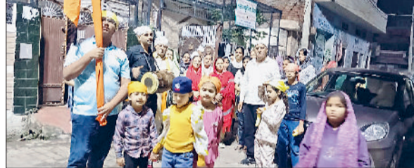
महम। शहर में प्रभातफेरी निकालते गुरुद्वारा बाबा बंदा सिंह बहादुर के श्रद्धालु।