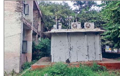
रोहतक। हरियाणा प्रदूषण नियंत्रण बोर्ड द्वारा महर्षि दयानंद विश्वविद्यालय में हरियाली के बीच स्थापित किया गया सीएक्वएमएस

हरियाणा प्रदूषण नियंत्रण बोर्ड (एचपीसीबी) रोहतक शहर के वास्तविक एक्वआईड पर पिछले 15 साल से चादर ताने खड़ा है। बोर्ड ने अपना कंटीन्यूअस एम्बेडेट एयर क्वालिटी मॉनिटरिंग स्टेशन (सीएक्वएमएस) महर्षि दयानंद विश्वविद्यालय में स्थापित किया हुआ है। ध्यान रहे कि विश्वविद्यालय कैम्पस को वर्ष 2018 में देश का सबसे हरा-भरा परिसर घोषित किया गया था।